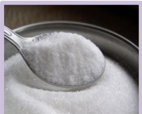
น้ำตาลทราย