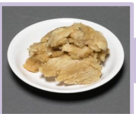
น้ำตาลมะพร้าว