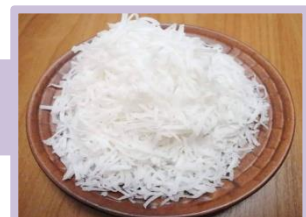
มะพร้าวขูดฝอย