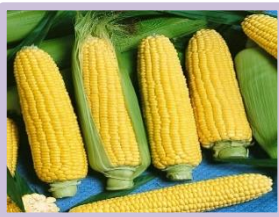
ข้าโหดดิบ

การประกอบอาหารข้าป่าดข้าโหด ต้องมีการเตรียมเครื่องปรุง ดังนี้