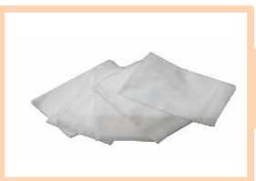
ผ้าขาวบาง