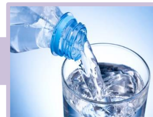
น้ำเปล่า